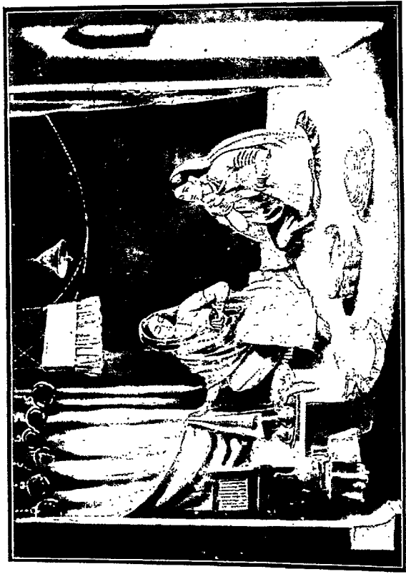
परम भक्तिमती मीराबाई

'राणा सांप पिटासीमें भेज्यो, सालिगराम भयो'